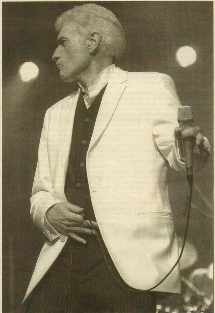
SPECTACLE - Dennis DeYoung a accepté de donner un deuxième spectacle au Théâtre du Palais municipal de La Baie. Le projet était dans l'air depuis quelques jours et il a été confirmé par l'artiste lui-même, tout de suite après sa sortie de scène dimanche dernier.