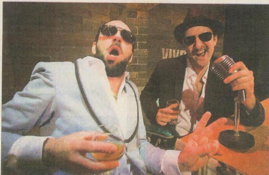
Le duo de chanteurs humoristes Sèxe Illégal montera sur scène à la première soirée du Festival de l'Internet d'Alma, le 22 août prochain à la Boîte à Bleuets.