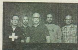
Le groupe Bad Religion se produira sur la Zone portuaire de Chicoutimi le 25 juillet.

« Le spectacle aura lieu pendant les vacances de la construction. J'imagine que ce sont des personnes qui seront dans la région à ce moment. C'est la seule explication que je