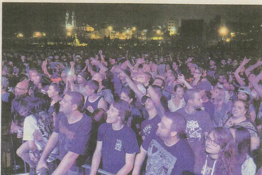
Les spectateurs auront été nombreux à s'adonner aux joies du « crowd surfing » et plusieurs verres de bière vides auront chatouillé le ciel.

Soulignons enfin que Bad Religion a livré hier soir une prestation digne d'une leçon