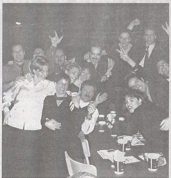
BONNE HUMEUR - Plus de 2000 personnes ont célébré de digne façon la dernière année avant le changement de millénaire. Et à voir les gens se trémousser aux sons de la musique des Running Shoes, entre minuit et 3 h, on peut affirmer que l'événement a été un succès sur toute la ligne. Ça promet pour le party soulignant la fin de siècle et l'entrée dans le nouveau millénaire!