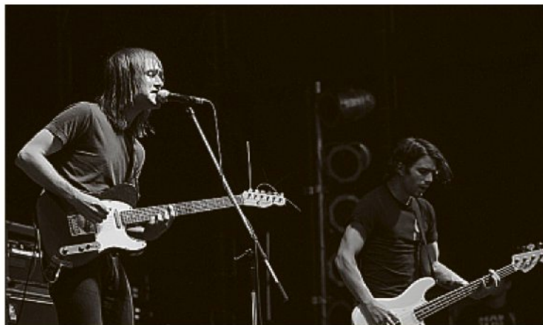
Le groupe rock Malajube était en spectacle, hier, dans le cadre du week-end de musique urbaine (WEMU).