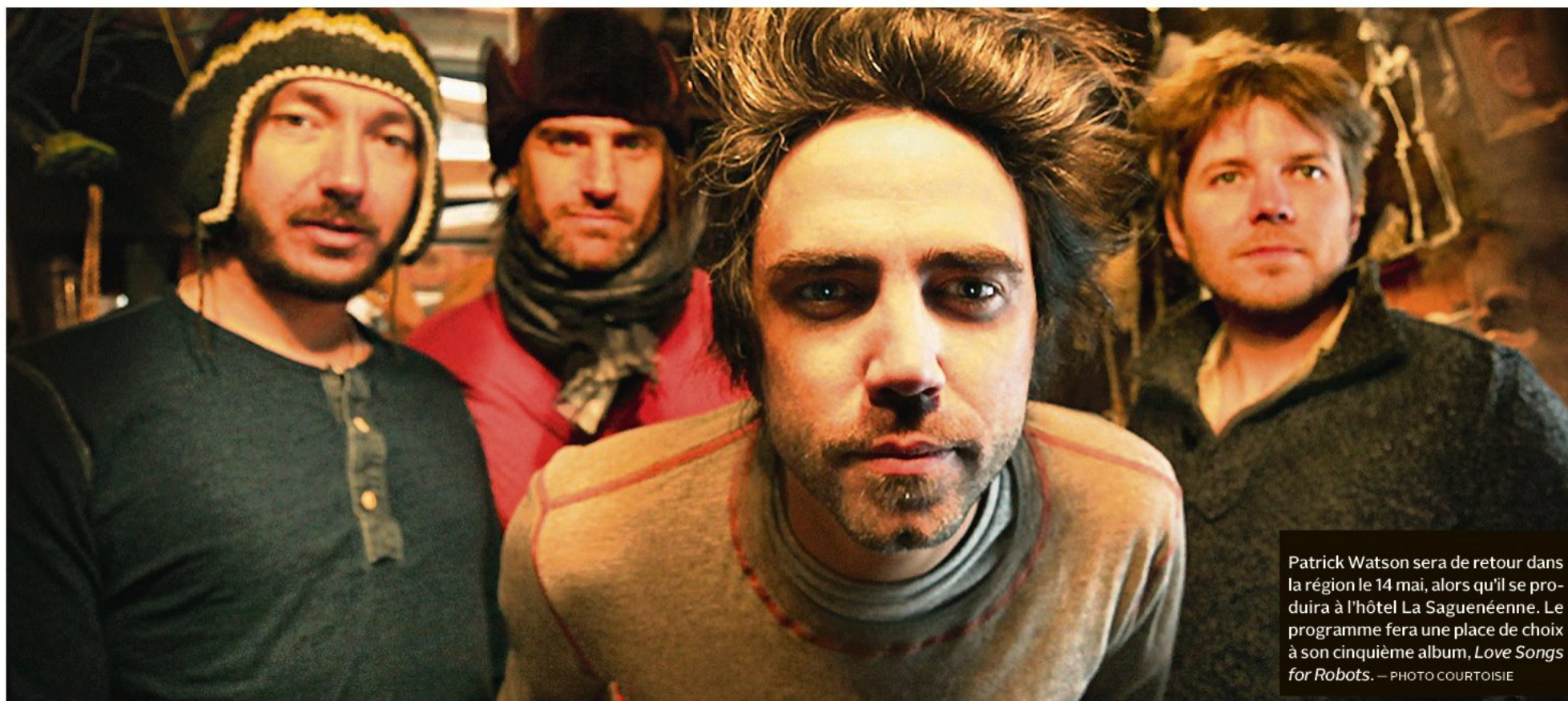
Patrick Watson sera de retour dans la région le 14 mai, alors qu'il se produira à l'hôtel La Saguenéenne. Le programme fera une place de choix à son cinquième album, Love Songs for Robots .