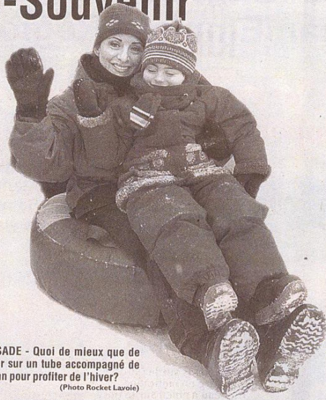
GLISSADE - Quoi de mieux que de glisser sur un tube accompagné de maman pour profiter de l'hiver?